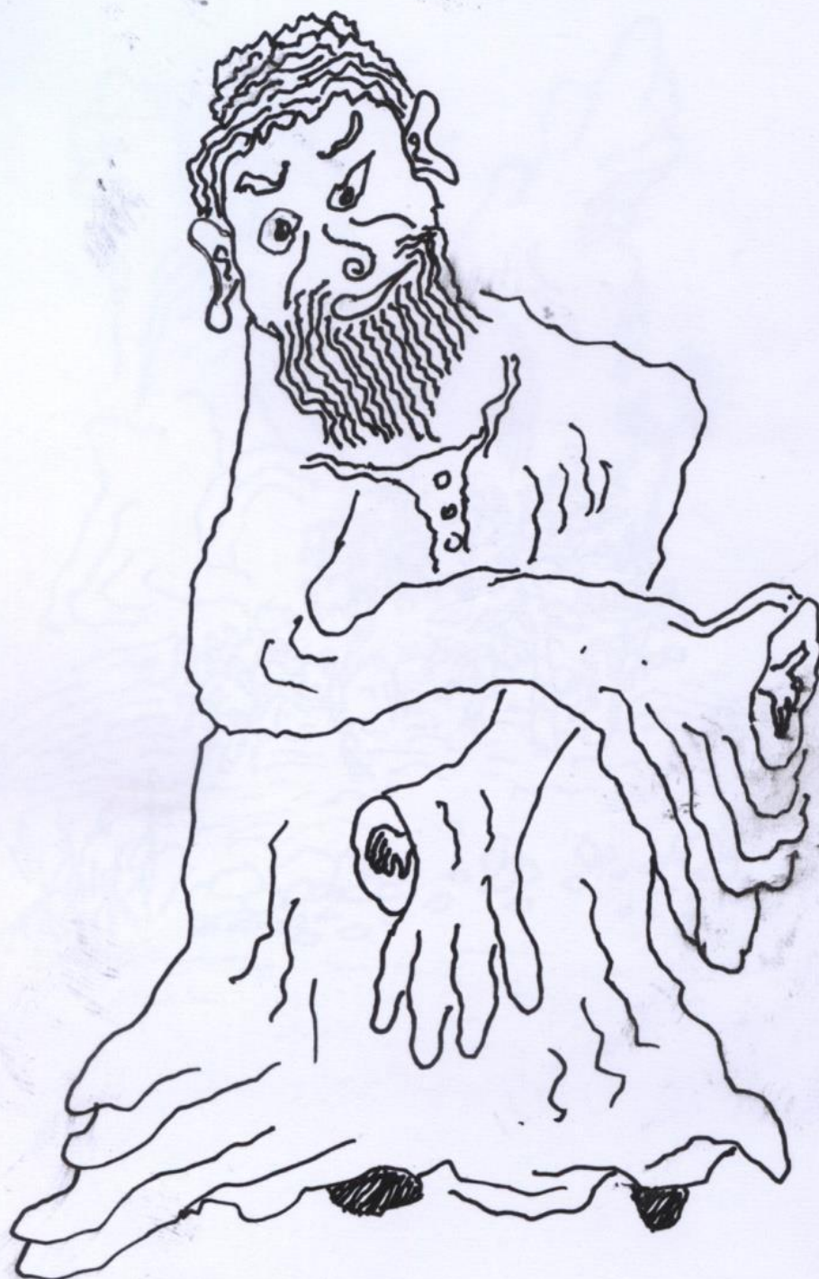
Философ, пытающийся схватить сущность. 20250201, 243-й вечер клуба "Подвал №1". 140x105 мм