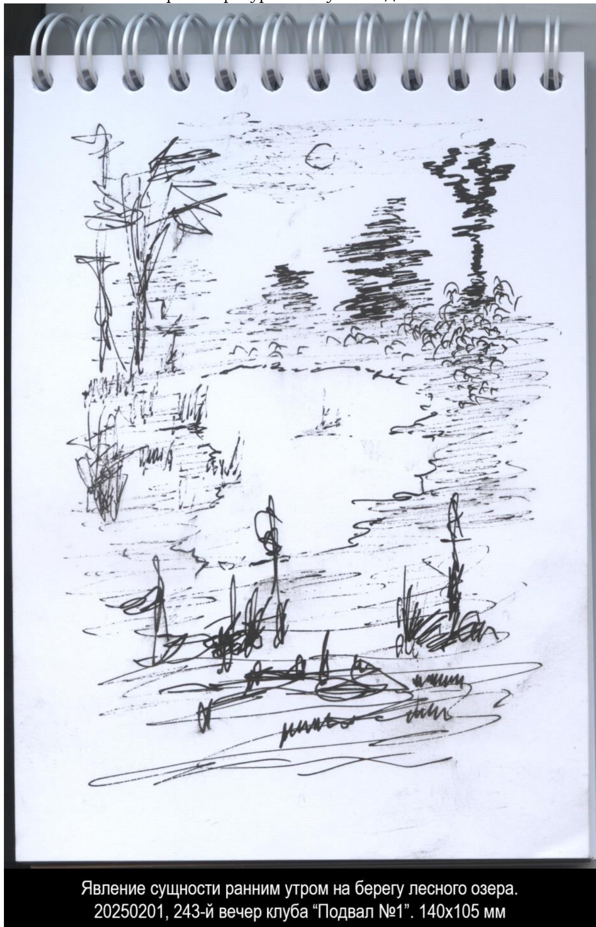
Явление сущности ранним утром на берегу лесного озера. 20250201, 243-й вечер клуба "Подвал №1". 140x105 мм