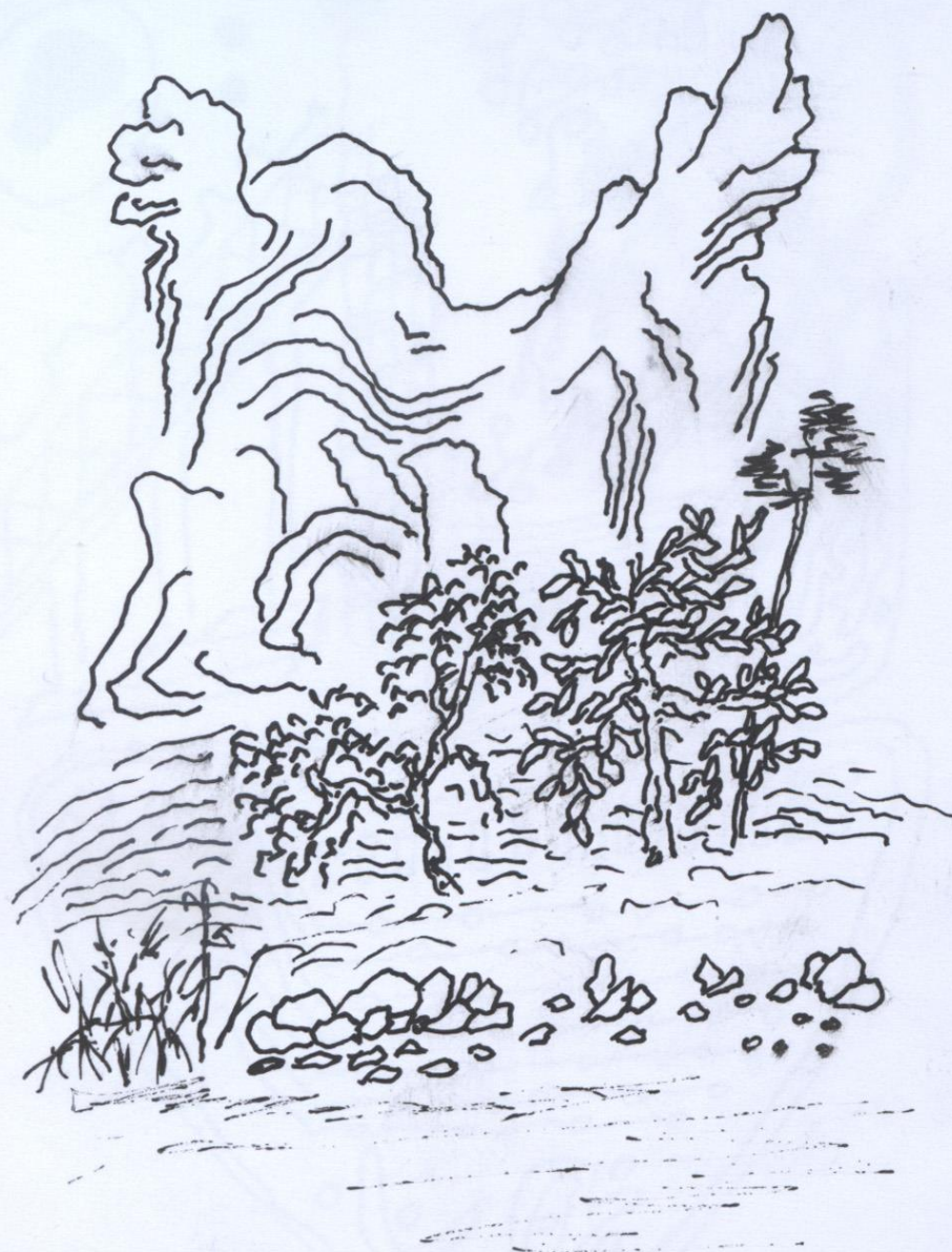
Скала, за которой скрывается сущность. 20250201, 243-й вечер клуба "Подвал №1". 140x105 мм